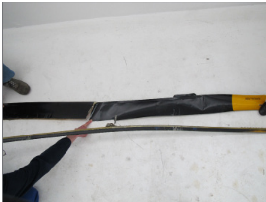
Photo reconstitution pale

Une des deux pales du rotor principal a été reconstituée avec une partie prélevée sur l'épave et le tronçon récupéré en décembre 2011. Les deux parties de la pale sont jointives. L'examen des impacts présents sur son bord d'attaque montre que la pale est entrée en collision avec la partie avant du patin gauche et la verrière. Ce contact n'est possible qu'après la divergence du plan de rotation du rotor principal suite à la rupture de la butée basse des pales principales.