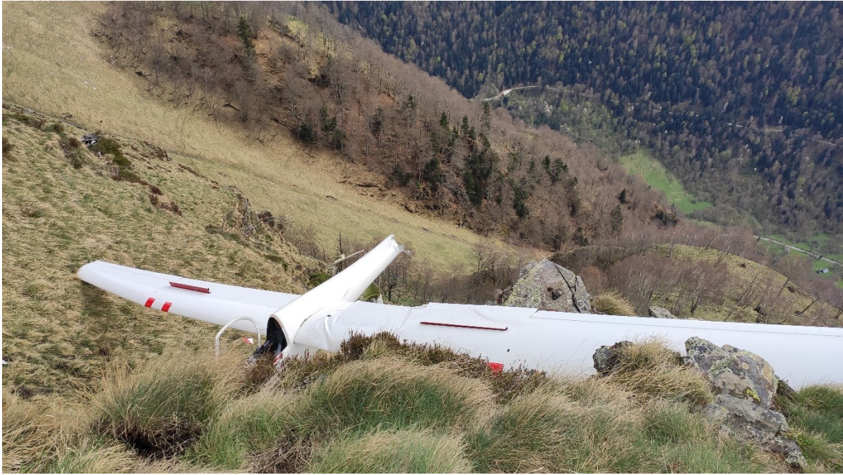
Figure 2 : photo de l'épave